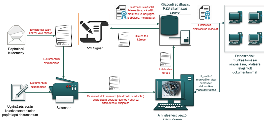
1. ábra: Papíralapú iratról hiteles elektronikus másolat készítésének rendszerszintű feldolgozási folyamata