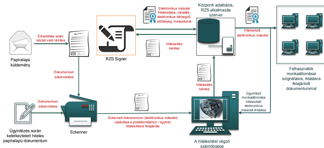
1. ábra: Papíralapú dokumentumról hiteles elektronikus másolat készítésének rendszerszintű feldolgozási folyamata

Az elektronikus aláírás, a metaadatrendszer elektronikus példányra történő bekerülésének biztonságát a szerver oldali feldolgozás biztosítja.