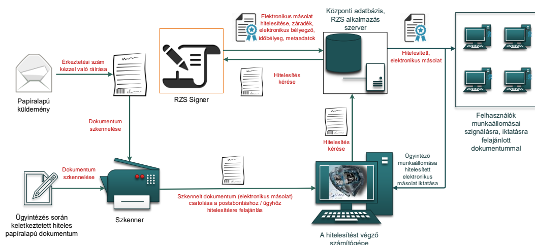
1. ábra: Papíralapú dokumentumról hiteles elektronikus másolat készítésének rendszerszintű feldolgozási folyamata