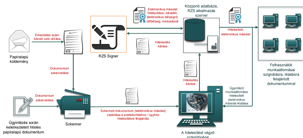
1. ábra: Papíralapú dokumentumról hiteles elektronikus másolat készítésének rendszerszintű feldolgozási folyamata