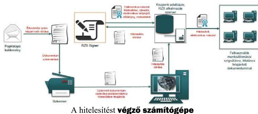
1. ábra: Papíralapú iratról hiteles elektronikus másolat készítésének rendszerszintű feldolgozási folyamata