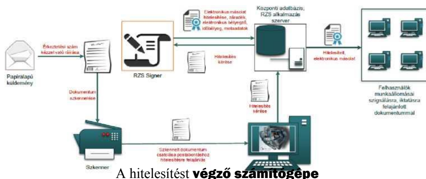
1. ábra: Papíralapú iratról hiteles elektronikus másolat készítésének rendszerszintű feldolgozási folyamata