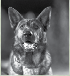
A Kántor nyomoz c. filmben a címszereplőt Tuskó, Kántor fia

Talán soha nem lett volna világszerte ismert név a Kántor, ha azon a napon, valamilyen 1953-ban a vas megyei rendőr hangja nem kelti fel a fél éves németjuhász kutya figyelmét és nem kötnek hirtelen egy életre szóló barátságot.