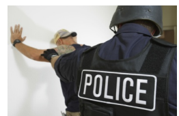
A képek illusztrációk.